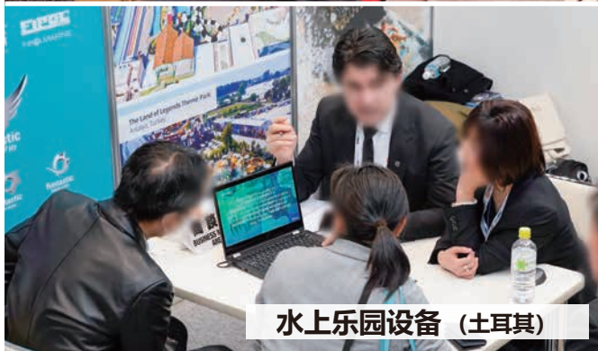
水上乐园设备 (土耳其)