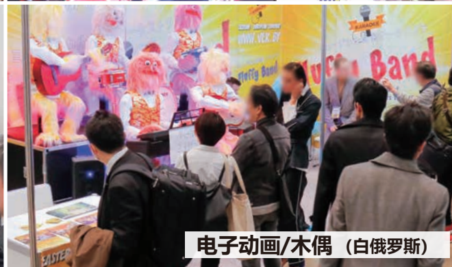
电子动画/木偶 (白俄罗斯)