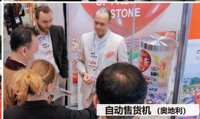
自动售货机 (奥地利)