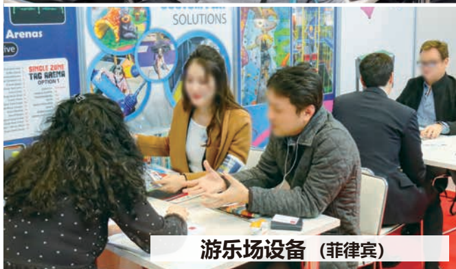
游乐场设备 (菲律宾)