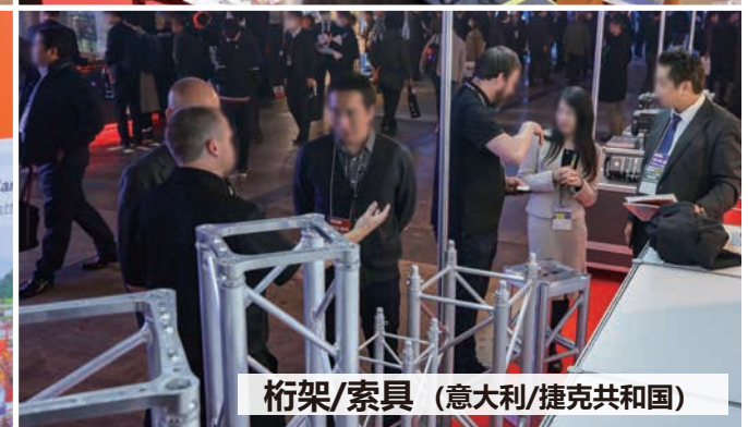
桁架/索具 (意大利/捷克共和国)